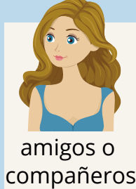
amigos o compañeros